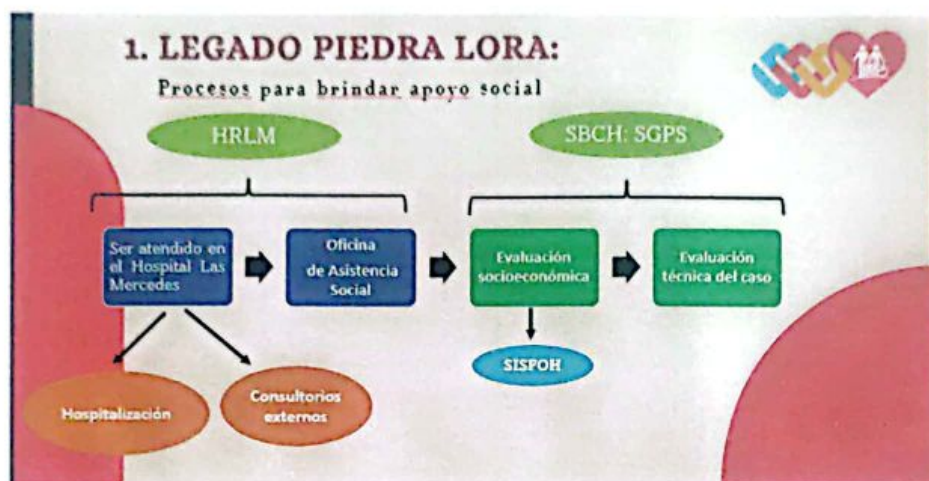
Gráfico N° 2: Flujograma del Proceso de aprobación del Apoyo Social

sustenta la viabilidad del apoyo, determinando si este será total o parcial, en función del diagnóstico social y los recursos disponibles.